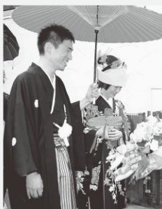
鎌倉ウェディングの挙式風景

一般社団法人の全日本ブライダル協会(桂由美会長)主催の「第1回ふるさとウェディング・コンクール」で、神奈川県鎌倉市の市役所職員有志による「鎌倉ウェディング」が7月、大賞に輝いた。観光庁長官賞に選ばれた。コンクールはブライダルを通じた地域振興を目的としており、「長官賞」では、建長寺や鶴岡八幡宮など古都ならではの名所・旧跡を活用し、花嫁支度を自宅で整え挙式に臨むなど、地域ぐるみでカップルの前向きな振舞いを演出し、写真が評価された。 ブライダル・ファッションデザイナーの桂由美は「幸せに輝く花嫁姿が街中であふれたら、あふれがけから結婚が増え子育ての第一歩」と波及効果を期待する。来年以降は全国各地のブライダルプロデューサーに呼び掛け、その土地ならではの挙式の様子を収めたDVDなどを募集し、コンクルの裾野を広げていく考え。 震災復興に取り組み岩手県の「鎌倉市民結婚式2012」が特別奨励賞に選ばれた。問い合わせ先URLは http://www.aiba-civil.or.jp/